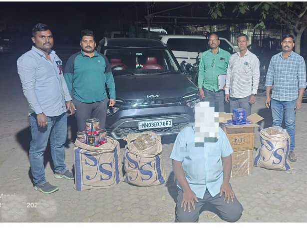
राज्यामध्ये विक्रीसाठी प्रतिबंधित केलेला ०९ लाख २१ हजार ८७० रुपयांचा गुटखा, सुगंधित तंबाखू व एक पिकअप वाहन असा एकूण ०९ लाख २१ हजार ८७०