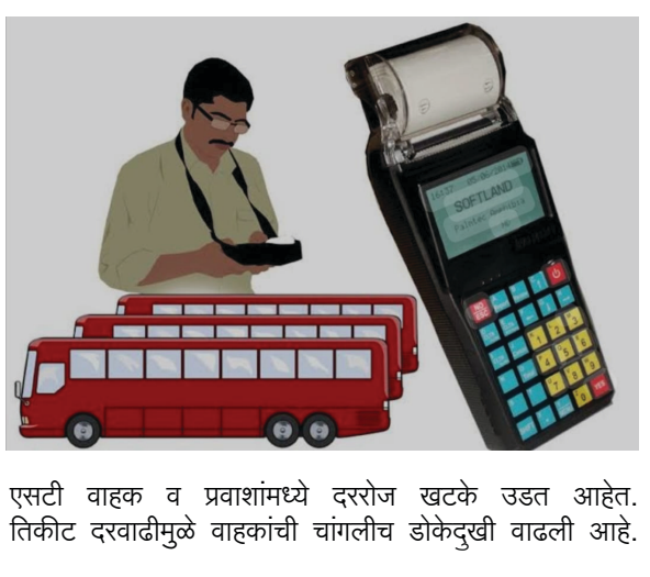
एसटी वाहक व प्रवाशांमध्ये दररोज खटके उडत आहेत. तिकीट दरावाढीमुळे वाहकांची चांगलीच डोकेदुखी वाढली आहे.

वरिष्ठ अधिकारी म्हणतात ग्राहकांच्या तक्रारीची दखल घेत नाही. पूर्णांकामध्ये तिकीट दर नसल्याने सुट्ट्या पैशाला घेवून वाहकाला वादाला समोर जावे लागत आहे. किंबहुना भुईड सोसावा लागत आहे. या प्रकाराला घेवून वाहकांकडून वरिष्ठांकडे तक्रार करण्यात आली. मात्र एसटीचे वरिष्ठ अधिकारी या संदर्भात पुढे निर्णय घेण्यात येईल, असे सांगून मोकळे होत आहेत. या तिकीट वाढीने वाहकाला दररोज १०० ते २०० रुपयाचा भुईड सोसावा लागत आहे. रुपये, ६१ रुपये, ७१ रुपये अशा कारण्यात आल्या आहेत. पूर्णांक संख्येत तिकीट दर नसल्याने प्रवासी थेट १०० किंवा ५० रुपयाची नोट देवून मोकळा होता. अशात वाहक प्रवाशांना एक रुपये सुट्टे मागतो. तेव्हा प्रवासी देत नाही. अशा परिस्थितीत वाहकाला एक प्रवाशाला ९ रुपये परत करणे अक्वड जाते. परिणामी वाहकाला एक रुपयाचा भुईड सोसणे भाग पडत आहे. तर दुसरीकडे एक रुपयासाठी प्रवाशांच्या रोषाला सामोरे जावे लागत आहे. विशेष म्हणजे, सुट्ट्या एक रुपयाकरीता