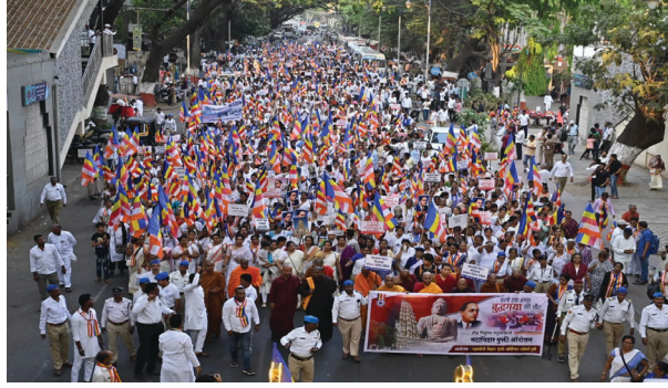
महाविहार आहे त्याच्या उजव्या बाजूस बौद्ध मूर्ती सापडून देखील तिथे इतर देवी देवतांची मंदिरे उभारली जात आहेत. तथागत भगवान गौतम बुद्धांची जन्मभूमी म्हणून आज जागतिक स्तरावर भारताकडे आदराने पाहिले जाते. अन् आज त्याच देशात महाबोधी महाविहार मुक्तीसाठी जगभरात आनंदोलन केली जात आहेत.