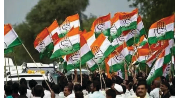
चांगली कामगिरी केली असली तरी विधानसभा निवडणूक काबीज करण्यात पक्षाला मोठे अपयश आले. राज्यासह संभाजीनगर जिल्ह्यात पक्षाचा सुपडासाफ झाला. यामुळे येणा-या महापालिका निवडणुकीच्या अनुषंगाने नवे प्रदेशाध्यक्ष स्थानिक कार्यकारिणीत मोठे फेरबदल करण्याची शक्यता वर्तवली जात आहे. दरम्यान, इच्छुक उमेदवारांनी त्यासाठी वरिष्ठांकडे लॉबिंगदेखील सुरु केली असल्याचे सांगितले जात आहे.

छ. संभाजीनगर : प्रतिनिधी सध्या महापालिका निवडणुकांच्या हालचाली सुरु आहेत. अशावेळी काँग्रेसमध्ये फेरबदल होण्याची शक्यता वर्तवली जात आहे. लोकसभेत महाविकास आघाडी अंतर्गत काँग्रेसने चांगले काम केले. दरम्यान, राज्य काँग्रेस कमिटीचे प्रदेशाध्यक्ष म्हणून हर्षवर्धन सपकाळ यांची निवड झाली आहे. आज त्यांनी काँग्रेस प्रदेशाध्यक्षपदाचा पदभार स्वीकारला. दरम्यान, 'नवा भिडू, नवा राज' याप्रमाणे स्थानिक कार्यकारिणीतही खांदेपालटाचे वारे वाहत असून, अनेक कार्यकर्त्यांनी यासाठी लॉबिंग सुरु केल्याची चर्चा आहे. बुलडाण्याचे हर्षवर्धन सपकाळ यांची प्रदेशाध्यक्षपदावर निवड झाल्यानंतर आता कार्यकारिणी बदलाची चर्चा सुरु झाली आहे. राज्यभरासह छत्रपती संभाजीनगर शहर व जिल्ह्यातही बदल होणार असल्याचे बोलले जात आहे. नव्याने शहराध्यक्ष आणि जिल्हाध्यक्ष बदलले जाणार अशी चर्चा काँग्रेसच्या पदाधिकारी, कार्यकर्त्यांमध्ये केली जात आहे. त्यामुळे नव्याने शहराध्यक्षपदाच्या निवडीसाठी अनेकांच्या मनात पालवी फुटायला सुरुवात झाली आहे. लोकसभा निवडणुकांमध्ये जरी काँग्रेसने मविआसोबत