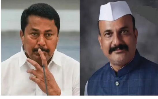
लोकसभा निवडणुकीत ४८ पैकी १३ जागा जिंकण्यात काँग्रेसला यश आले. यानंतर विधानसभा निवडणुकीत पक्षाची कामगिरी आणखी सुधारेल असे वाटत होते

नवी दिल्ली : महाराष्ट्रात काँग्रेसने मोठे फेरबदल केले असून पक्षाने गुरुवार दि. १३ फेब्रुवारी रोजी नाना पटोले यांचा राजीनामा मंजूर करीत त्यांच्या जागी हर्षवर्धन वसंतराव सपकाळ यांची महाराष्ट्राचे नवे अध्यक्ष म्हणून नियुक्ती केली. तर विजय वडेझीवार यांची विधीमंडळ गटनेतेपदी निवड करण्यात आली आहे. विधानसभा निवडणुकीतील दारुण पराभवानंतर नाना पटोले यांनी अध्यक्षपदाचा राजीनामा देण्याची तयारी दर्शवली होती. गेल्या वर्षाच्या अखेरीस झालेल्या विधानसभा निवडणुकीत नाना पटोले यांच्या नेतृत्वाखाली काँग्रेसला दारुण पराभवाला सामोरे जावे लागले होते. राज्यातील २८८ जागांपैकी केवळ १६ विधानसभेच्या जागा जिंकल्या. यानंतर त्यांच्या नेतृत्वावर प्रश्न उपस्थित होऊ लागले. मात्र,