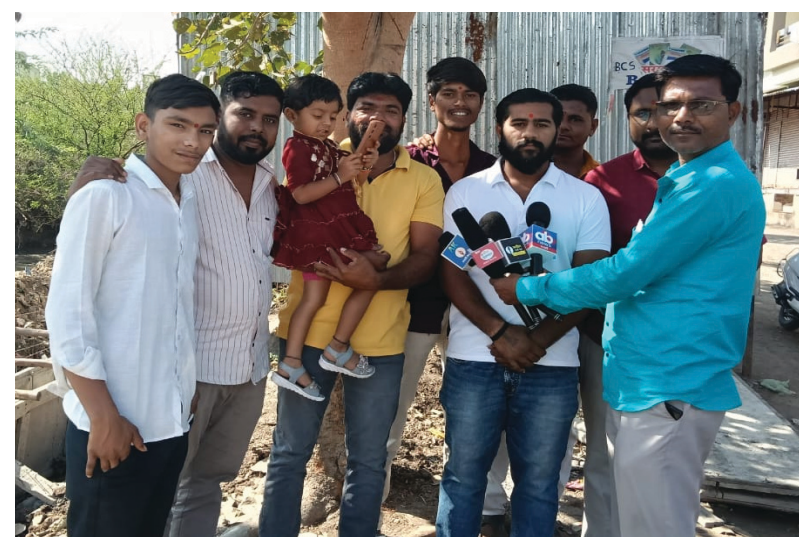
काम केल्याबद्दल आम्ही सर्वांचे आभार मानतो आमच्या या भागातील महत्त्वाचा प्रश्न मार्गी लागला असल्यामुळे आम्ही समाधानी आहोत