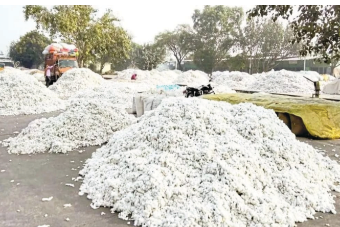
आदिलाबाद या प्रसिद्ध कापूस बाजारपेठेत नेऊन विक्री करत

खरेदी केंद्र सुरू झाले नाही. खरेदी केंद्र मंजूर असतानाही सीसीआयचे केंद्र सुरू न झाल्याने खासगी व्यापारी गरजवंत शेतकऱ्यांचा कापूस हमी भावापेक्षा कमी दराने खरेदी करत आहेत. त्याच ओलावा आहे म्हणून कट्टी करून खरेदी करीत असल्याने ही लूट थांबवण्यासाठी कॉटन कॉर्पोरेशन ऑफ इंडिया (सीसीआय) खरेदी केंद्र कधी सुरू करणार, असा प्रश्न निर्माण झाला आहे. शेतकऱ्यांचा कापूस खासगी व्यापाऱ्यांच्या घशात जात असतानाही सीसीआयला खरेदी केंद्र सुरू करण्याचा मुहूर्त सापडला नसल्याने आश्चर्य व्यक्त होत आहे. काही शेतकरी सीमावर्ती तेलंगणाच्या