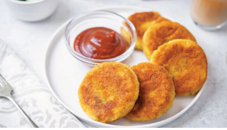
मटार आणि बटाटा उकडवून थंड झाल्यानंतर बाऊलमध्ये घेऊन मंश लसूण पेस्ट, लाल तिखट, हळद, जिरे पावडर आणि चवीनुसार मीठ त्यानंतर त्यात हिरवी मिरची आलं लसूण पेस्ट, लाल तिखट, हळद, जिरे पावडर आणि चवीनुसार मीठ हा पदार्थ तुम्ही सांस किंवा हिरव्या चटणीसोबत खाऊ शकता.

साहित्य: मटार उकडलेला बटाटा कॉर्नफ्लोअर मीठ कोथिंबीर हिरवी मिरची आलं लसूण पेस्ट चाट मसाला लाल तिखट चवीनुसार साखर जिरे पावडर आमचूर पावडर कृती: आलू मटार टिक्की बनवण्यासाठी सर्वप्रथम ओले वाटणे आणि बटाटा कुकरमधून उकडवून थंड करून घ्या.