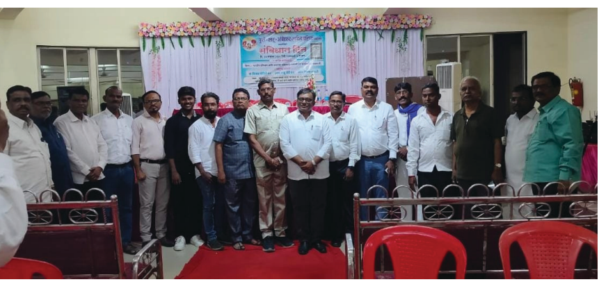
समता, स्वातंत्र्य, बंधूत्व व सामाजिक न्याय ही तत्वे संविधानात मांडलेली आहेत तसेच डॉ. बाबासाहेबांनी शिका एर्वीलर्रीश, संघटित व्हा जीसरपळश, संघर्ष करा षळसर्हीं षौ ळषर्क्षीळलश, म्हटले तर या वाक्याचा शब्दच्छल करून सांगणारा दुसरा एक वर्गप्रवाह म्हणतो की, शिक्षित करा -एर्वीलर्रीश आंदोलन करा- -सर्ळीर्रीश संघटित रहा. -सरपळश. या प्रकारे लोकांना जागृत करणारांचे ठायी ठायी असणारे मतभेदोचे विचारप्रवाहानी चळवळ खिळखिळी झाली आहे. हे सुद्धा कारण असू शकते. विचार करा. हे गृहीतक विरोधाभाषी असून चळवळ एकसंघ न होण्यास पुरेसं आहे. असं म्हटलं तर वावगं होणार