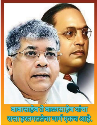
बाबासाहेब ते बाळासाहेब यांचा सत्ता हस्तगततेचा पारंग एकच आहे.

आहे. मी तेथे गेलो तेव्हा माझ्या खात्यात अस्पृश्यांचे हमालसुद्धा नव्हते. मी गेल्यापासून आपले पुष्कळ लोक मोठ्या हुद्द्यावर चढले आहेत. आपल्यापैकी एक डेप्युटी सेक्रेटरी टू दी गवरनमेंट ऑफ इंडिया आहे. दुसरा एक अन्डर सेक्रेटरी आहे. तीन एक्झिक्युटिव्ह इंजिनियर आहेत. सिमल्याला माझा डिपार्टमेंटचा एक भाग आहे. तेथे एकंदर २८ क्लार्क आहेत. त्यापैकी १८ भंगी आहेत. आता डेप्युटी सेक्रेटरीज २, अंडर सेक्रेटरी व १ व एक्झिक्युटिव्ह इंजिनियर्स ३ असे अस्पृश्य वांचे लोक भरले आहेत. कोणी म्हणतात की, मी महाराजचेच हित करतो. मी महाराज जाती जन्मलो याला मी काय करू. पण माझ्याविरुद्ध केली जाणारी ही तक्रार खोटी आहे. माझ्याच खात्यात सिमल्याला २८ क्लार्क पैकी १८ भंगी आहेत. विलायतेला जाणाऱ्या लोकात १ मांग, १ भंगी व चांभार पुष्कळ आहेत. मी आणखी एक गोष्ट यातच सांगू इच्छितो. एक मळकट असा भंगी अस्पृश्यांचा उमेदवार जेव्हा मुलाखती करता सिमल्याला आला तेव्हा त्याला खात्रीने नकार मिळेल हे जेव्हा मला