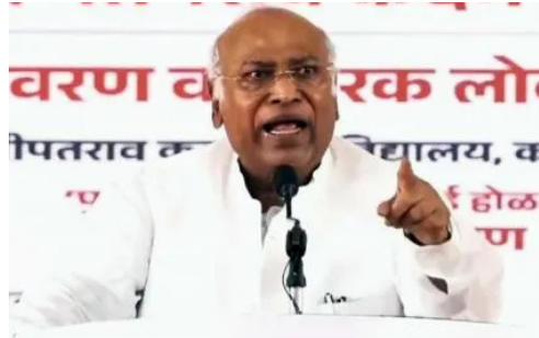
शाळेतील अभ्यासक्रम बदलत आहेत. संविधान

सरकार आल्यास लाडकी बहीण योजनेचे पैसे २ हजार रुपये करू, असे आश्वासन काँग्रेसचे अध्यक्ष मल्लिकार्जुन खरगे यांनी दिले. शिवाजी महाराज यांच्या पुतळ्याला हात लावला तो पडला, राम मंदिराला हात लावला ते गळत आहे, गुजरातच्या पुलाचे उद्घाटन केले तर तो पुल पडला, मोदी येत आहेत, म्हणून पुतळा लवकर बनवा आणि तो बनवला आणि पडला, अशी टीका खरगे यांनी पंतप्रधान मोदींवर केली. आरएसएसवाले बनवतात ते पडत आहे.