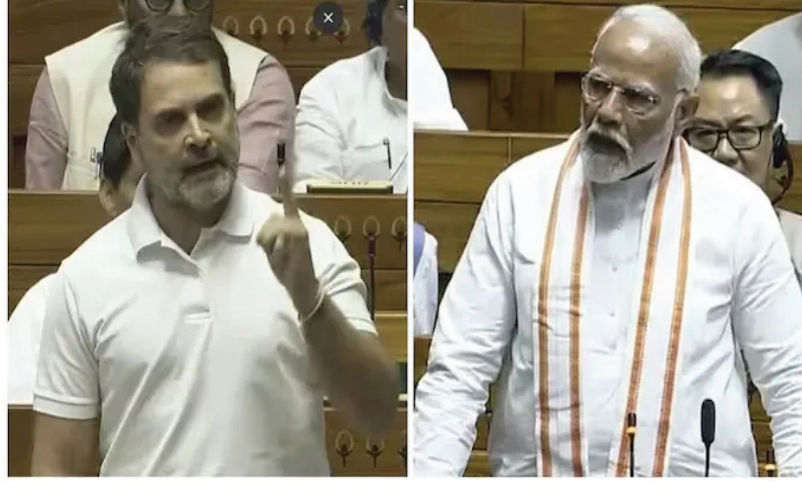
आरएसएसच्या लोकांना सांगू इच्छितो की, ज्या कल्पनेने आम्ही आणि संपूर्ण विरोधकांनी आमचा बचाव कसा केला. ही कल्पना कुटून आली आणि सरकारशी लढण्याची हिंमत

राहुल गांधींनी दाखवला महादेवाचा फोटो जेव्हा तुमच्यावर असे हल्ले होतात तेव्हा तुम्हाला आश्रय हवा असतो, असे राहुल गांधी म्हणाले. त्यामुळे आज मी भाजप-