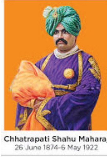
Chhatrapati Shahu Maharaj 26 June 1874-6 May 1922