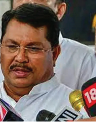
राज्यातील राजकीय वातावरण तापू लागले असून दोन्ही समाजाच्या नेत्यांमध्ये आरोप-प्रत्यारोप होत आहेत.