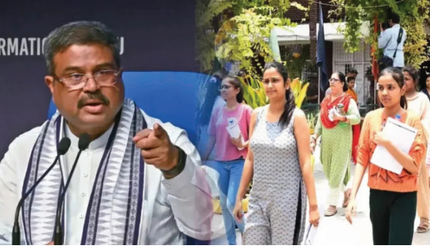
लागेल. ते रशिया-युक्रेन युद्ध थांबवतील, पण पेपरफुटी

एनटीएने नीट-यूजी २०२४ पुनर्परीक्षेचे प्रवेशपत्र जारी केले आहे. वेळेच्या कमतरतेमुळे सवलतीचे गुण मिळालेल्या १५६३ उमेदवारांसाठी ही परीक्षा घेतली जात आहे. परंतु पुन्हा परीक्षा घायची की नाही किंवा वाढीव गुण काढून टाकल्यानंतर शिल्लक राहिलेल्या गुणांसह पुढे जायचे हे उमेदवारांवर सोडण्यात आले आहे. नीट पुनर्परीक्षेचे प्रवेशपत्र अधिकृत वेबसाइटवर डाऊनलोडसाठी उपलब्ध आहे. २३ जून रोजी दुपारी २ ते ५.२० या वेळेत ही परीक्षा होणार आहे. तिचा निकाल ३० जून रोजी जाहीर होण्याची शक्यता आहे. संसदेत मुद्या उपस्थित करणार पंतप्रधान मानसिकदृष्ट्या खचले आहेत आणि सरकार चालविण्यासाठी त्यांना संघर्ष करावा