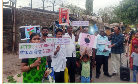
मनदार राजा जागा हो, लोकशाहीचा धागा हो... अशा पद्धतीने मतदानाची टक्केवारी वाढवण्याकरिता मुंबई उपनगरातील कादिवलीत दामू नगर मार्केट परिसरात निवडणूक अधिकारी व कर्मचाऱ्यांसोबत विभागातील जनतेने हातात फलके घेत आपला उत्स्फूर्तपणे सहभाग नोंदवला.

शहरात येणाऱ्या वाहनांना भलेही फेरा झाला तरी चालेल पण केवळ एखाद्या ठिकाणीच अँप्रोच (जोड रस्ते) घायाला हवा होता. किनवट बसस्थानक परिसरात महामार्गावर खासगी वाहनांची वर्दळ मोठी असून शिस्त नाही. शहरातून येणारे वाहन अचानक कधी वळवेल हे सांगणे कठीण आहे. यातूनच वाहने एकमेकांना धडकण्याची भीती व्यक्त होत आहे. नियोजनाचा अभाव असलेल्या राष्ट्रीय महामार्ग प्राधिकरण विभागाने लक्ष देऊन संभाव्य अपघात टाळण्यासाठी उपाय करावेत, अशी मागणी सजाण नागरिक करीत आहेत.