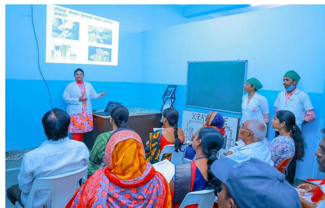
केल्यास दात कायमस्वरूपी गमवावे लागू शकतात, तोंडातील

निघणारे नुकसान होते मात्र संबंधीत दंत रोगाची लक्षणे रुग्णांना जाणवत नाहीत. त्यासाठी प्रत्येकाने किमान सहा महिन्यातून एकदा तरी दंत वैद्याकडून तपासणी करून घ्यावी. तोंड व दातांची अस्वच्छता, जंतू संसर्ग, व्यसनानिधना, अपघात, अपूर्ण झोप, संतुलीत आहाराचा अभाव, जंकफुड, डबाबंद खाद्यपदार्थांचे सेवन, रसायनयुक्त शीतपेयांचा अतिवापर, इतर शारीरिक आजार, बदलती जिवनशैली, चुकीचे पध्दतीने ब्रश करणे आणि प्राथमिक लक्षणांकडे दुर्लक्ष करणे या कारणांमुळे मुख - दंत रोग होतात. मुख व दंत रोग उद्भवल्यानंतर दात व दाढांमध्ये वेदना होणे, दात किडणे व हलणे, दातांची झिज होणे, हिरड्यांना सुज येणे, हिरड्यांमधून पू येणे, पांढरे - लाल चट्टे, तोंडात गाठ तयार होणे, जबड्याचे साधे, स्नायु दुखणे, तोंडातील जखमा, ग्रण येणे, तोंड कमी उघडणे, तोंड बंद न होणे अशी लक्षणे दिसून येतात. अशी लक्षणे दिसून आल्यास दंत वैद्याकडून तपासणी करून आवश्यक उपचार घ्यावेत. त्याचबरोबर पुढील काळात नियमितपणे तपासणी करून घ्यावी. दंत रोगांच्या लक्षणांकडे दुर्लक्ष