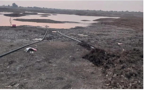
शेतीसाठी केला जात होता. कालांतराने सदर यंत्राना कमी पाणीसाठयामुळे मोडकळीस आली.

लातूर : प्रतिनिधी लातूर तालुक्यातील अनेक गावांना रायगव्हाण मध्यम प्रकल्पातून पाणी पुरवठा होतो. सध्या उन्हाळ्यामुळे या प्रकल्पातील पाणी कांही शेतकरी शेतीला वापरत आहेत. त्यामुळे प्रकल्पात अत्यंत कमी पाणी शिल्लक राहिल्याने प्रकल्पातील पाण्याचा होणारा उपसा थांबला नाही, तर नागरीकांना उन्हाळ्यात तीव्र पाण्याची टंचाई जाणार आहे. जिल्हा प्रशासनाने नागरीकांना प्रकल्पातील पाणी पिण्यासाठी राखीव ठेवण्याच्या सूचना असतानाही रायगव्हाण प्रकल्पातून पाण्याचा जोरदारपणे उपसा सुरू आहे. या पाणी उपशाला निर्बंध लागणार का असा प्रश्न निर्माण झाला आहे. लातूर तालुक्यातील रायगव्हाण प्रकल्पातून पूर्वी पाठाद्वारे पाणी पुरवठा