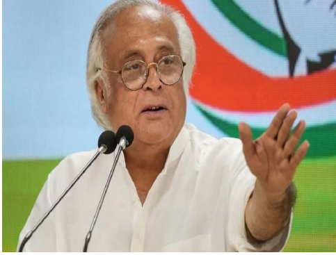
जाती, हे महत्त्वाचे मुद्दे आहेत.काय म्हणाले होते झूठ मोदी ? लोकसभा निवडणुकीसाठी काँग्रेसने प्रसिद्ध केलेल्या जाहीरनाम्यावर मुस्लिम लीगची छाप आहे. जुनी काँग्रेस यामध्ये कोठेही दिसत नाही. यामध्ये डावे

: जनसंघ पक्षाचे संस्थापक श्यामाप्रसाद मुखर्जींनी जिना यांच्या मुस्लिम लीगसोबत करार केला होता. काँग्रेसने कधीच करार केला नव्हता. भाजप नेते लालकृष्ण अडवाणी आणि जसवंत सिंग यांनी पाकिस्तानात जाऊन पाकिस्तानचे दिवंगत पंतप्रधान जिना यांची प्रशंसा केली.कोणत्याही काँग्रेस नेत्याने तसे केले नाही, अशा शब्दांमध्ये काँग्रेसचे ज्येष्ठ नेते जयराम रमेश यांनी '—छब'शी बोलताना पंतप्रधान नरेंद्र मोदींच्या टीकेला प्रत्युत्तर दिले.यावेळी जयराम रमेश म्हणाले की, काँग्रेस पक्षाचा जाहीरनामा आठ कोटी घरांमध्ये जाणार आहे. शेतकरी न्याय, महिला न्याय, युवा न्याय, कामगार न्याय. आमचे कार्यकर्ते आणि नेते आठ कोटी कुटुंबांपर्यंत पोहोचत आहेत. आम्ही देशासमोरील खरे मुद्दे मांडले आहेत देशासमोर, महिला, शेतकरी, तरुण, कामगार, वंचित लोक, मागासवर्गीय लोक, अनुसूचित जाती आणि अनुसूचित