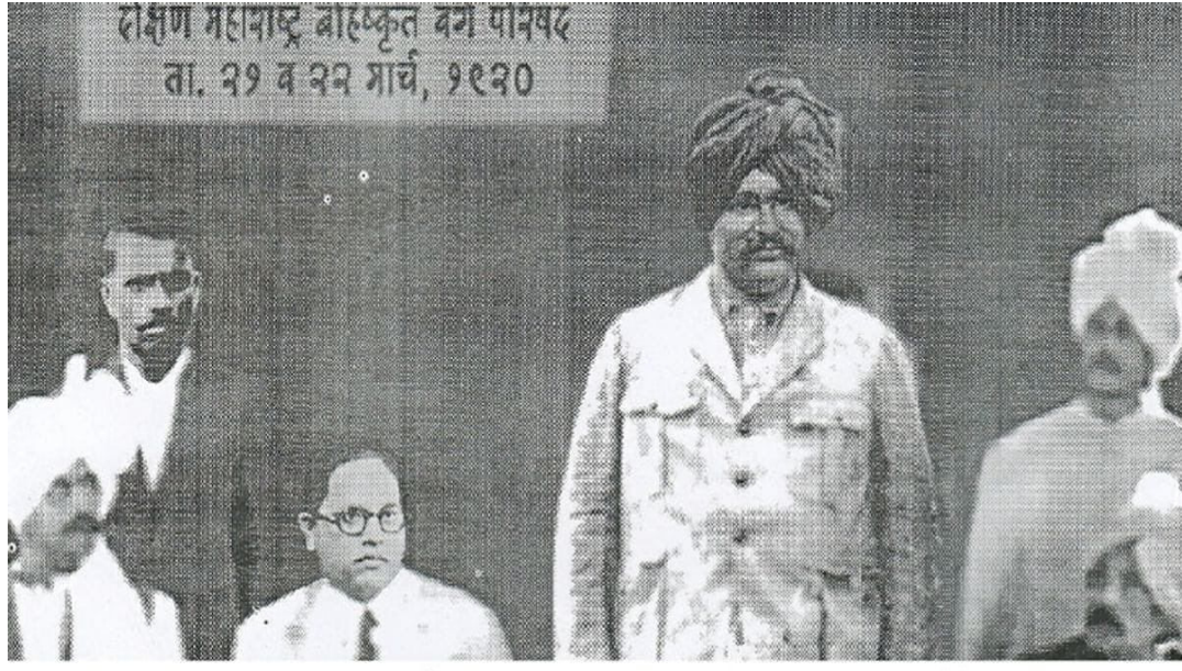
राजर्षी शाहू महाराज, डॉ. बाबासाहेब आंबेडकर यांच्या उपस्थितीत झालेल्या माणगाव परिषदेचे संग्रहित छायाचित्र.

डॉ. बाबासाहेब आंबेडकर यांच्या अध्यक्षतेखाली व छत्रपती शाहू महाराज यांच्या प्रमुख उपस्थितीत २१ व २२ मार्च १९२० रोजी कोल्हापूर येथील माणगाव येथे अस्पृशांची परिषद झाली. डॉ. बाबासाहेब आंबेडकर आणि छत्रपती शाहू महाराज या दोन महामानवांचे अतिशय जिज्ञासूय संबंध होते ते आपल्याला इतिहासात अनेक ठिकाणी पाहायला मिळतात. माणगाव येथील परिषदेत पहिल्याच दिवशी डॉ. बाबासाहेब आंबेडकर यांनी आपल्या भाषणात बोलत असताना, इथल्या अस्पृशांच्या राजकीय, सामाजिक, गुलामगिरीला,त्यांच्या दुःखाला इथल्या मनुवादी व्यवस्था जबाबदार असल्याचे त्यांनी सांगितले. आपण सर्वांनी मिळून त्या विरोधात बंड पुकारून आवाज उठवण्याचे आव्हान डॉ. बाबासाहेब आंबेडकर यांनी केले. तर त्याच परिषदेत दुसऱ्या दिवशी म्हणजेच २२ मार्च रोजी छत्रपती शाहू महाराज यांनी आपल्या भाषणात, कोल्हापूर संस्थानात अस्पृश्यता नष्ट करण्यासाठी, महार वतन आणि ब्राह्मणी कुलकर्णी वतनाची जुलुमी प्रथा नष्ट करणे, सर्वच जातीतील लोकांना, तलाठी, वकील म्हणून काम करण्याची संधी मिळणे, असे