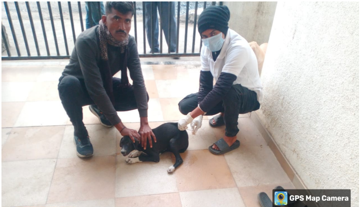
GPS Map Camera Latur, Maharashtra, India Kamble Nivas,Near Shinde High School,Vaibhav Nagar,Ganesh Mandir, Khadgaon, Road, Laxmi Dham Colony, Khadgaon, Latur, Maharashtra 413512, India Lat: 18.398262° Long: 76.558327° 27/01/24 07:19 AM GMT +05:30

लातूर/प्रतिनिधी: शहरातील श्वानांची वाढती संख्या व त्यामुळे वृद्ध नागरिक,लहान मुले आणि महिलांना होणारा त्रास लक्षात घेता मनपाच्या वतीने अँटीरेबीज लसीकरण मोहीम राबविण्यात येत आहे.या अंतर्गत आतापर्यंत ७८० भटक्या कुत्र्यांचे लसीकरण करण्यात आले असून आपल्या परिसरात भटक्या कुत्र्यांचा त्रास असेल तर संपर्क साधण्याचे आवाहन मनपा व उत्कर्ष ग्लोबल फाउंडेशनच्या वतीने करण्यात आले आहे. लातूर शहरात भटक्या कुत्र्यांची संख्या मोठ्या प्रमाणात आहे.यामुळे वृद्ध नागरिक,लहान मुले व महिलांना मोठा त्रास सहन करावा लागत आहे. अनेकदा ही भटकी कुत्री नागरिकांना चावा घेऊन जखमी करत आहेत.हा त्रास कमी करण्यासाठी भटक्या कुत्र्यांचे निर्बीजीकरण करणे आवश्यक आहे.त्यासाठी मनपाकडून मुलुंड येथील ग्लोबल फाउंडेशनच्या सहकार्यातून अँटीरेबीज लसीकरण करण्यात येत आहे.या अंतर्गत लसीकरण करून कुत्र्यांना त्यांच्या मूळ ठिकाणी सोडण्यात येते. कुत्र्यांचा वाढता त्रास लक्षात घेता ही प्रक्रिया अधिक परिणामकारक व गतिमान करण्याचा निर्णय महानगरपालिकेकडून घेण्यात आला आहे. त्यानुसार एप्रिल महिन्यापासून दर शनिवारी अँटीरेबीज लसीकरण मोहीम राबविली जाणार आहे.सध्याही प्रभाग निहाय लसीकरण केले जात आहे. ज्या भागात भटक्या कुत्र्यांचा त्रास अधिक आहे त्या भागातील नागरिकांनी उत्कर्ष ग्लोबल फाउंडेशनच्या ८६५५३२३१६८ या