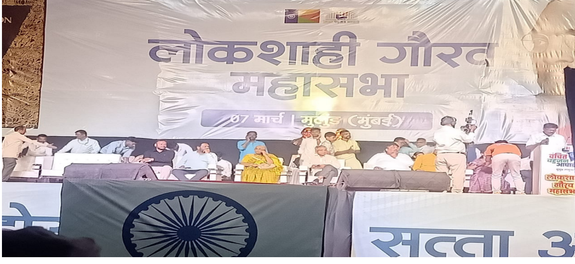
तेवढ्याच ताकतीने इतर पक्ष समूह भाजपाच्या विरोधात आहे. तो आपल्याला मदत केल्याशिवाय राहणार नाही. तरी आपण लढणार

काँग्रेसवाल्यांना सांगणं आहे मोदींना अंगावर घ्यायचा असेल, तर राहुल गांधींना पुढे करू नका. प्रियंका गांधींना पुढे करा, ती बरोबर ४-५ वाजवत असते, मोदीची पोल खोल करणे हे महत्वाचे आहे. असंही अॅड. प्रकाश आंबेडकरांनी सांगितले.