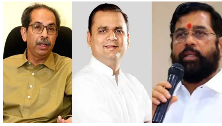
महले होते. ३१ सुरु होती तेव्हाच आमच्या लक्षात आले होते की वेळकाढूपणा करत आहेत, असे उद्भव करणार, असे उद्भव ठाकरे म्हणाले.

नार्वेकर आणि मुख्यमंत्री एकनाथ शिंदे यांच्यात झालेल्या भेटीवर आक्षेप घेत उबाठा शिवसेनेने सर्वोच्च न्यायालयात प्रतिज्ञापत्र दाखल केले आहे. देशात लोकशाही जिवंत राहणार की नाही? हे ठरवणारा निकाल असणार आहे. गेली दोन वर्षे त्यावर चर्चा, सुनावणी, उलट तपासणी सुरु आहे. गेल्या एप्रिलमध्ये सर्वोच्च न्यायालयाने योग्य वेळेत निकाल लावावा असे डिसेंबर तारीख दिली होती.