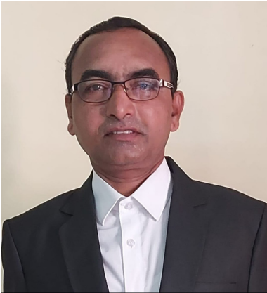
नावापुढे मी बाबासाहेबांचा कार्यकर्ता....

डॉ. बाबासाहेब आंबेडकर रांचा कार्यकर्ता नांवाची डिग्री कशी हाय रं...आंबेडकरी धम्म क्रांतीची रसद पुरविण्याची भूमिका तुमची आणि आमची प्रामाणिक असली पाहिजे.जिथे बाबासाहेबांचे पुरावे आहेत.लिखित आदेश आहेत ते मान्य करून रथ चालला पाहिजे.कोणतीही एक व्यक्ती.एक संघटना म्हणजे बाबासाहेबांचा समतेचा रथ होऊ शकत नाही.साहित्यातिल बाबासाहेब मस्तकात उतरविने हा काही एक दोन तासाचा किंवा एका दिवसाचा विषय नाही.सातत्य समर्पण टाईम मॅनेजमेंट करून हे अभ्यासाचे लागेल.तरच बाबासाहेबांचा कार्यकर्ता म्हणवून घेता येईल.प्रत्येक तालुका आणि जिल्हा पातळीवर समता सैनिक दल प्रशिक्षण केंद्र (ट्रेनिंग सेंटर) उभारून आंबेडकरी धम्म क्रांतीची रसद पुरविणारी आणि सक्षम मिशनरी सैनिक कार्यकर्ता घडविणारी यंत्रणा,मशीन उभी केली पाहिजे.खूप वर्ष वाया गेली आहेत. आता वेळ वाया घालवुन कसे चालेल. विविध संस्था आणायल्या पद्धतीने त्रेबुंज करीत आहे.यातून नक्कीच समाधान मिळत आहे.काहीशा प्रमाणात झीशी थोड देखिल करीत आहे.यातून रिझर्वट निघत आहे.हे अभिनंदणीय असे अभिमानास्पद कार्य आहे.याबाबत गर्व