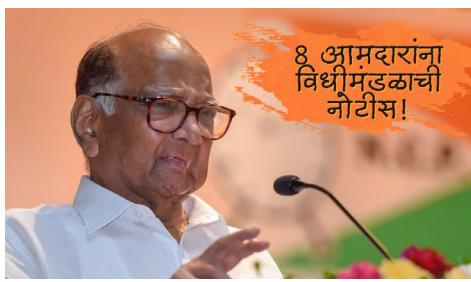
८ आमदारांना विधीमंडळाची नोटीस!

मुंबई : राष्ट्रवादीत फूट पडल्यानंतर निर्माण झालेल्या शरद पवार गट आणि अजितदादा गट यांच्यातील संघर्ष दिवसेंदिवस वाढताना दिसतो आहे. खरा पक्ष कोणाचा? यावरून त्यांच्यात आता कायदेशीर लढाई देखील सुरु झाली आहे.यापार्श्वभूमीवर शरद पवार गटाच्या ८ आमदारांना विधीमंडळानं नोटीस पाठवली आहे. तसेच या आमदारांना ८ दिवसांत आपलं म्हणणं मांडण्याचे आदेश दिले आहेत. अजित पवार गटाची याचिका पक्षविरोधी कृती केल्यामुळे आपल्याला अपात्र का करू नये? अशी याचिका अजित पवार गटानं विधीमंडळात दाखल केली होती. याबाबत म्हणणं मांडण्यासाठी विधीमंडळानं शरद पवार गटातील आमदारांना नोटीस पाठवली आहे. या आमदारांना समोरच्या गटानं केलेल्या आरोपांवर आपलं म्हणणं मांडण्यासाठी ८ दिवसांची वेळ देण्यात आली आहे. 'या' आमदारांना नोटीस नाही दरम्यान, शरद पवार गटाकडून लवकरच यावर उत्तर दाखल करण्यात येणार आहे. आत्तापर्यंत शरद पवार गटातील १० आमदारांना